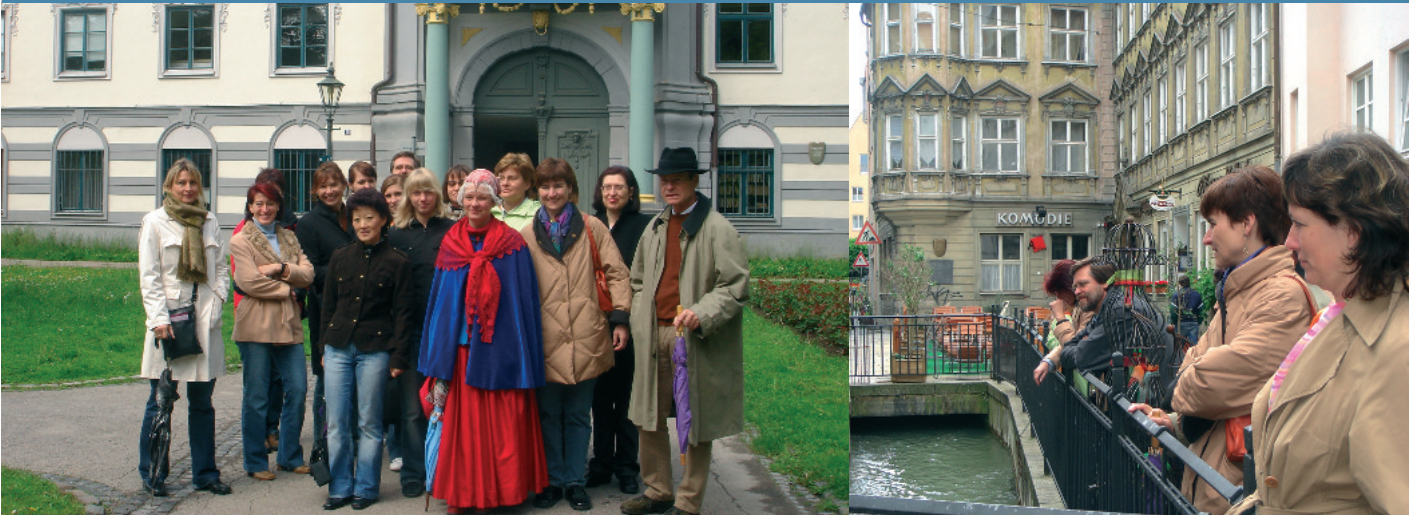
Das Begleitprogramm widmete sich „Mozarts erster Liebe – dem Augsburger Bäsle“