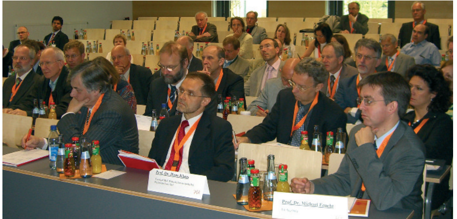
Tagungsteilnehmer im Auditorium