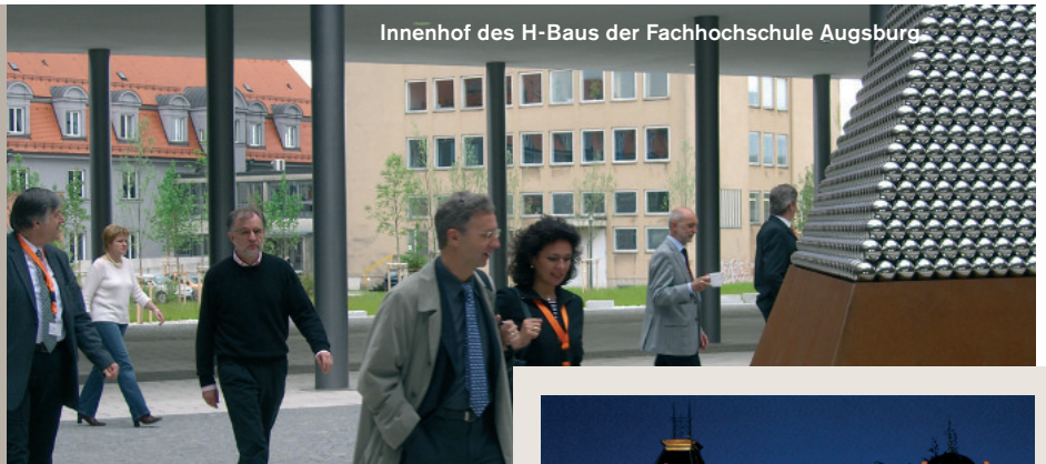
Innenhof des H-Baus der Fachhochschule Augsburg

Das offizielle Tagungsprogramm endete mit einem gemeinsamen Mittagmenü in der neu gebauten Cafeteria, das in Abstimmung mit dem Studentenwerk der Fachhochschule Augsburg für die Tagungsteilnehmer zusammengestellt wurde.