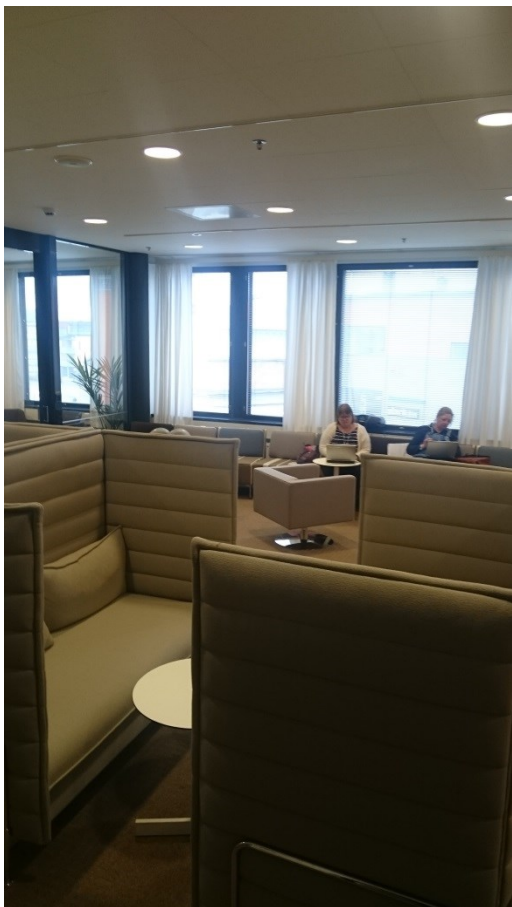
Workshop-Raum am Haaga-Helia Pasila Campus