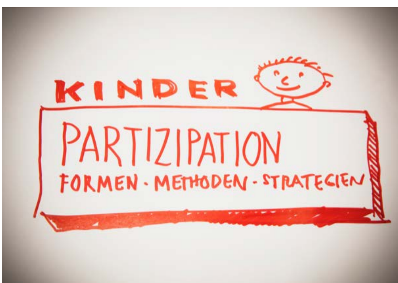
Kinder können planen – mit den richtigen Methoden

Denn im Wintersemester 2019/2020 nimmt die Expedition Pausenhof im Studiengang Architektur (B. A.) anhand dieser Ergebnisse Kurs auf konkrete Planungsentwürfe und Architektur-Modelle. Architektur-Studierende werden dann Vorschläge zeigen, wie die bewegten Pausen in der Wittelsbacher Grundschule in Zukunft aussehen könnten.