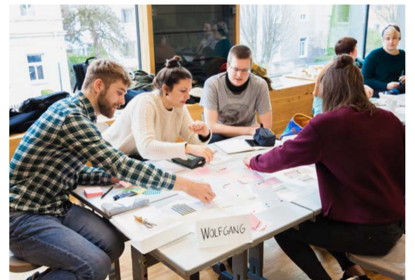
Studierende entwickeln neue Ideen für den Pausenhof

Mit diesem Wissen führten sie im Sommer mehrere Planungs- und Ideenfindungs-Workshops mit Eltern, Lehrern und Kindern vor Ort in und mit der Grundschule durch.