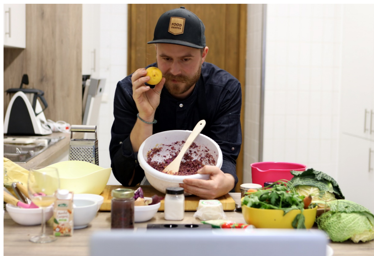
Food-Fighter Christopher König

Die Gewinner:innen konnten sich nicht nur über den Kochkurs mit Food-Fighter Christopher König freuen, sondern erhielten hierfür auch im Voraus eine Kochbox. Enthalten waren neben den für den Kochkurs notwendigen Zutaten auch die Rezepte zum Mitkochen, die Gewinner:innen-Urkunde und eine Kochschürze aus dem Augsburger Textilmuseum. Bei der Auslieferung bestand die Chance, Christopher König persönlich kennenzulernen.