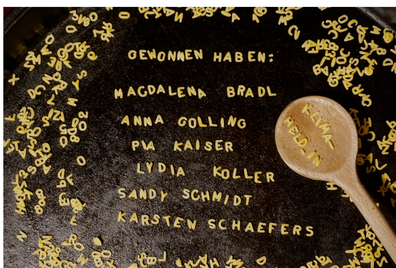
Die Gewinner:innen

Am Freitag, 13.11.2020 wurden die sechs Siegerinnen und Sieger bekanntgegeben. Zu gewinnen gab es einen Kochkurs mit dem Küchenmeister und Food-Fighter Christopher König aus der Region. In den drei Altersklassen „12-17 Jahre“, „18-21 Jahre“ und „22-25 Jahre“ wurden jeweils zwei Gewinner:innen gekürt.