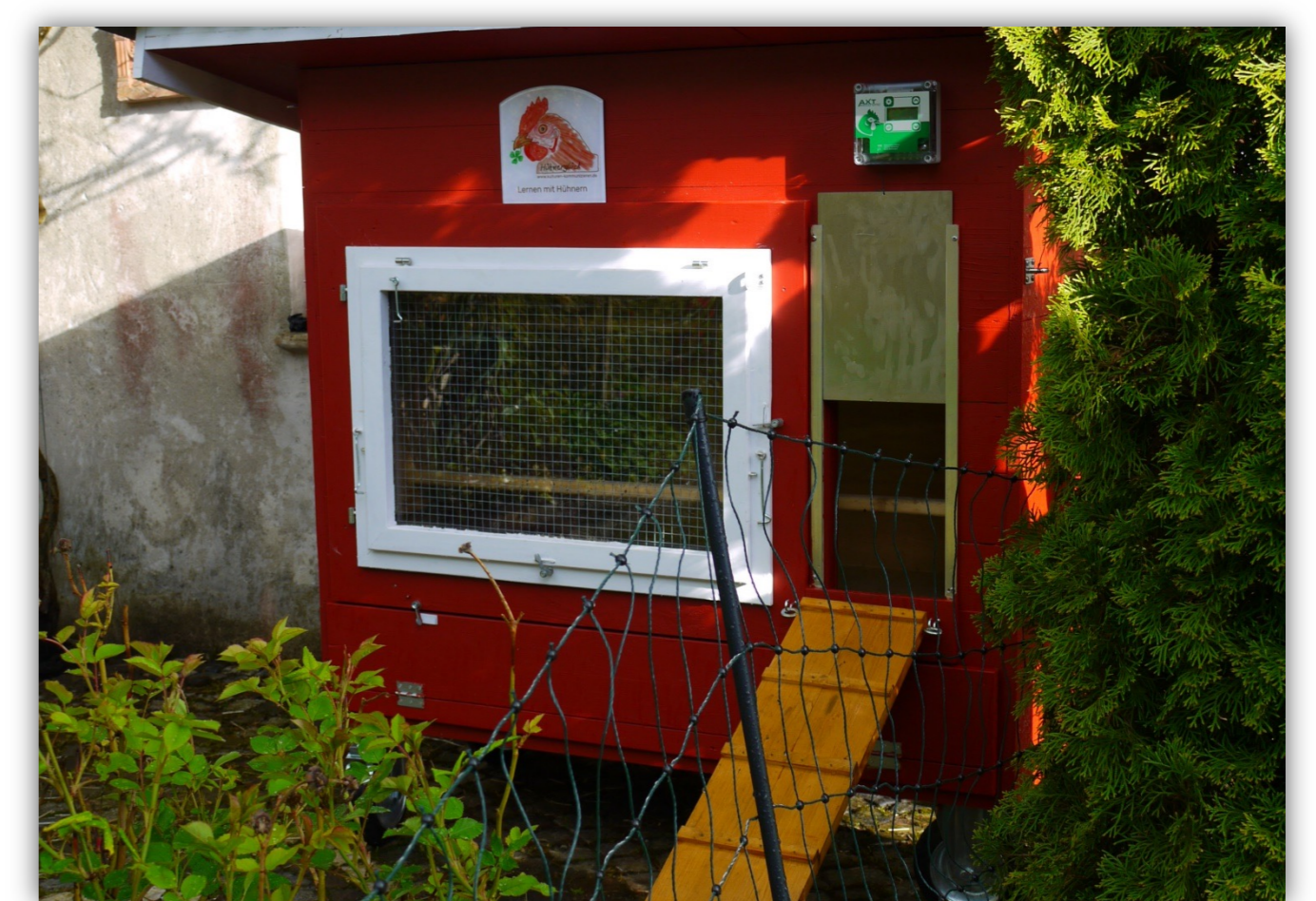
Hühnermobil im Nachhaltigkeitslabor