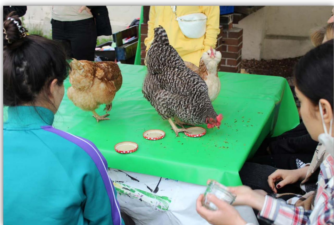
Geflügelte Dozentinnen

Projektpartner sind soziale Einrichtungen wie Wohnheime für Kinder und Jugendliche und Menschen mit Behinderung ebenso wie reguläre Kindertagesstätten in Augsburg und der Region.