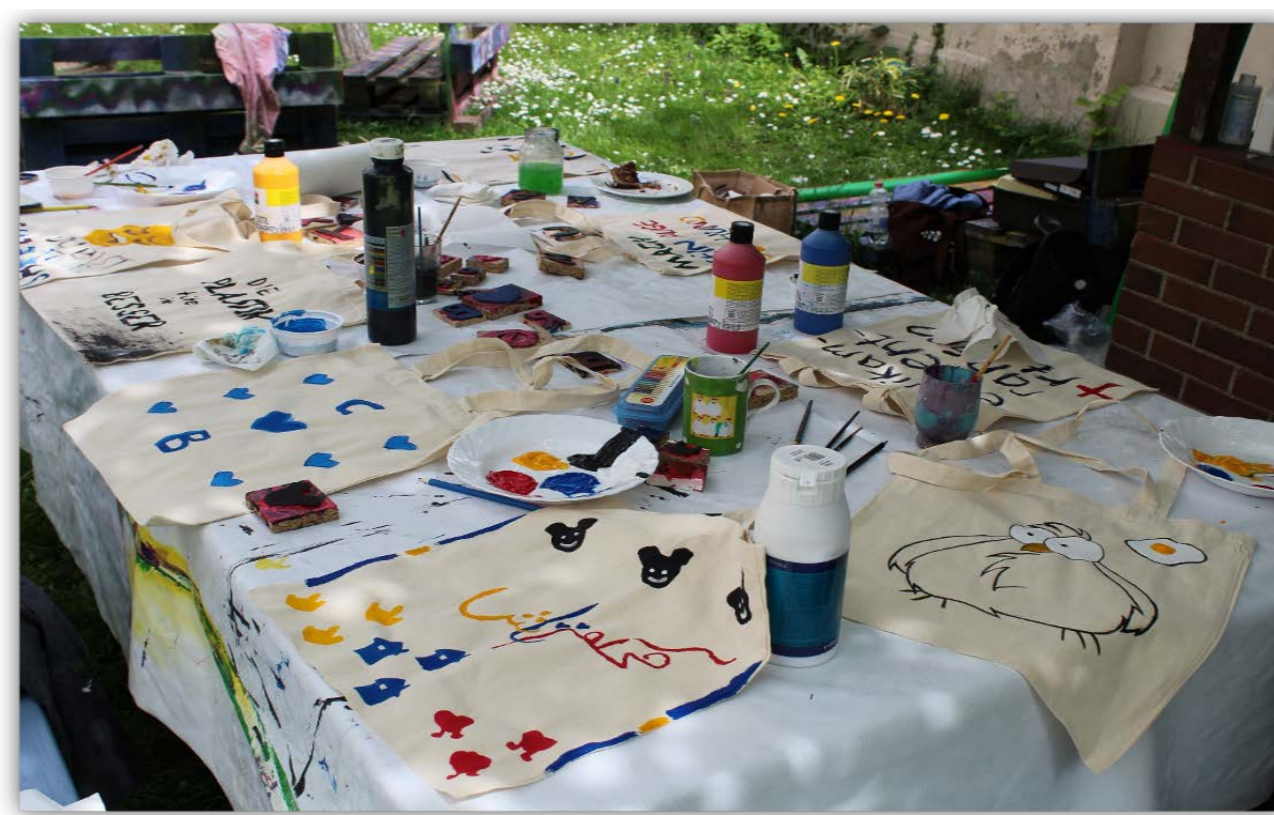
Kreative Ausbeute