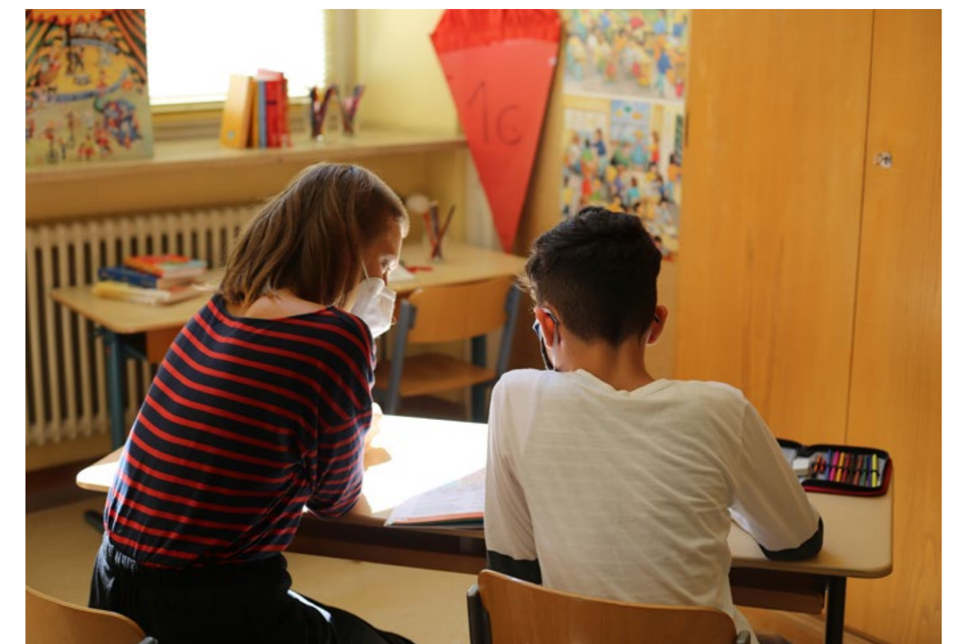
Hilfreiche Unterstützung beim Lösen der Aufgaben.

Forschungsgruppe für optimierte Wertschöpfung – HSA_ops Projektkoordinatorin