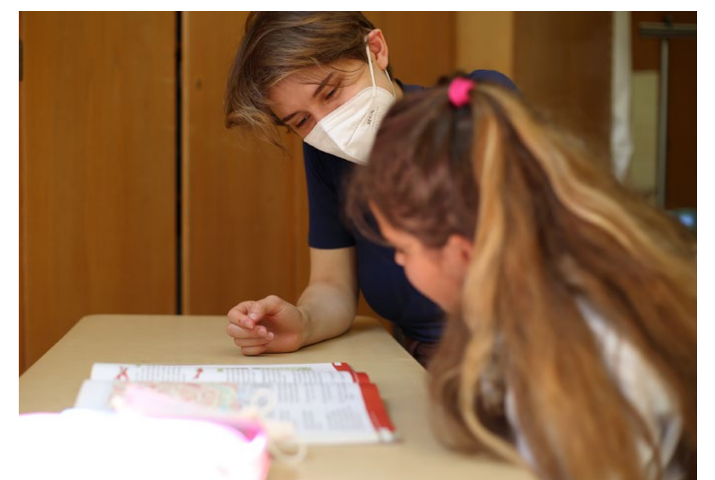
Wissenslücken werden erkannt und geschlossen.