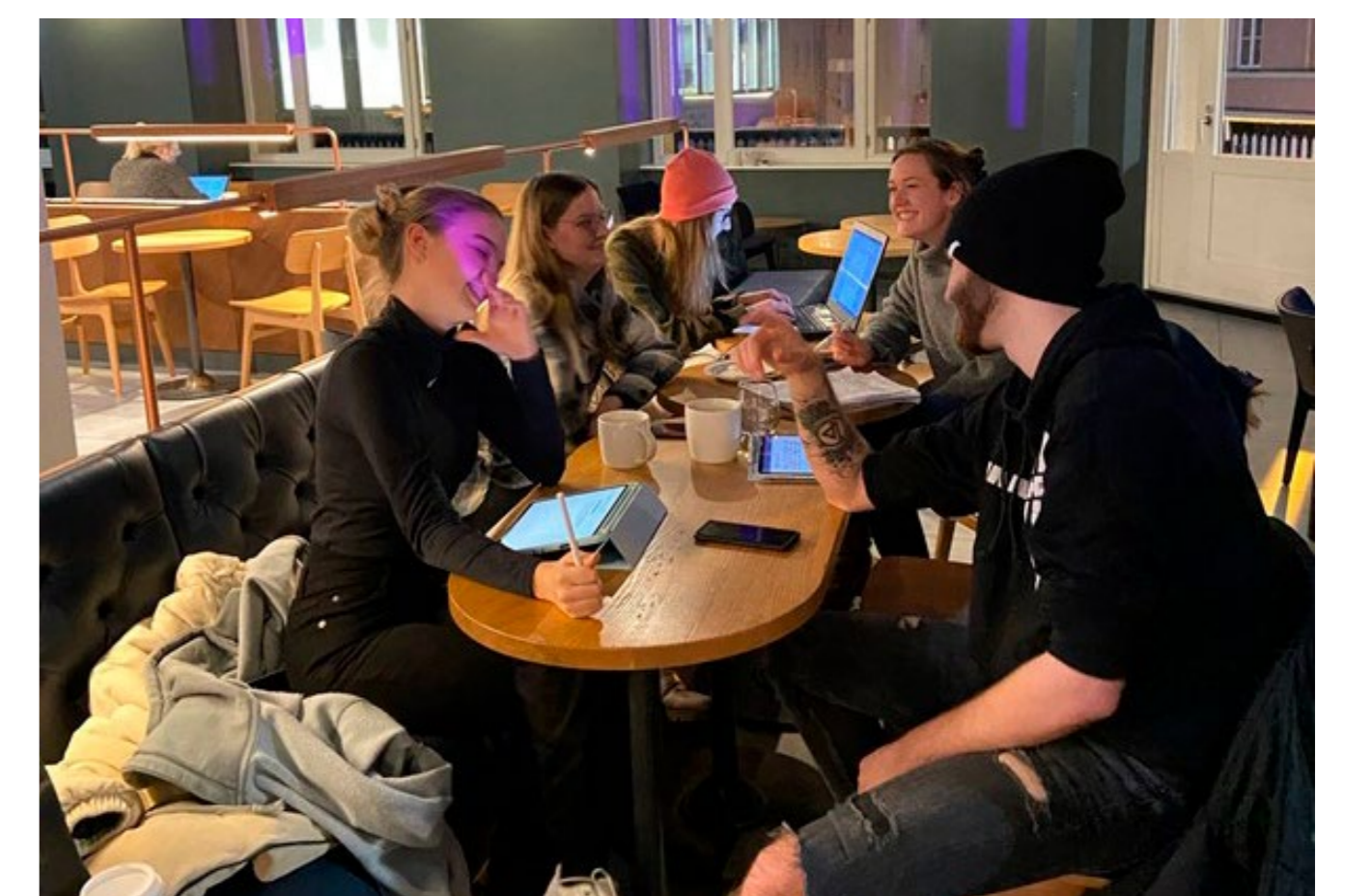
Das Projektteam bei der Konzeption des Workshops „Precious Plastic an Schulen“.

Der Workshop wird erstmalig im Frühjahr 2022 an der Schillerschule in Augsburg durchgeführt und gibt damit den Startschuss für eine kontinuierliche Sensibilisierungs- und Aufklärungskampagne an Schulen, die im Rahmen des Projekts „Precious Plastic“ der Hochschule Augsburg weitergeführt wird.