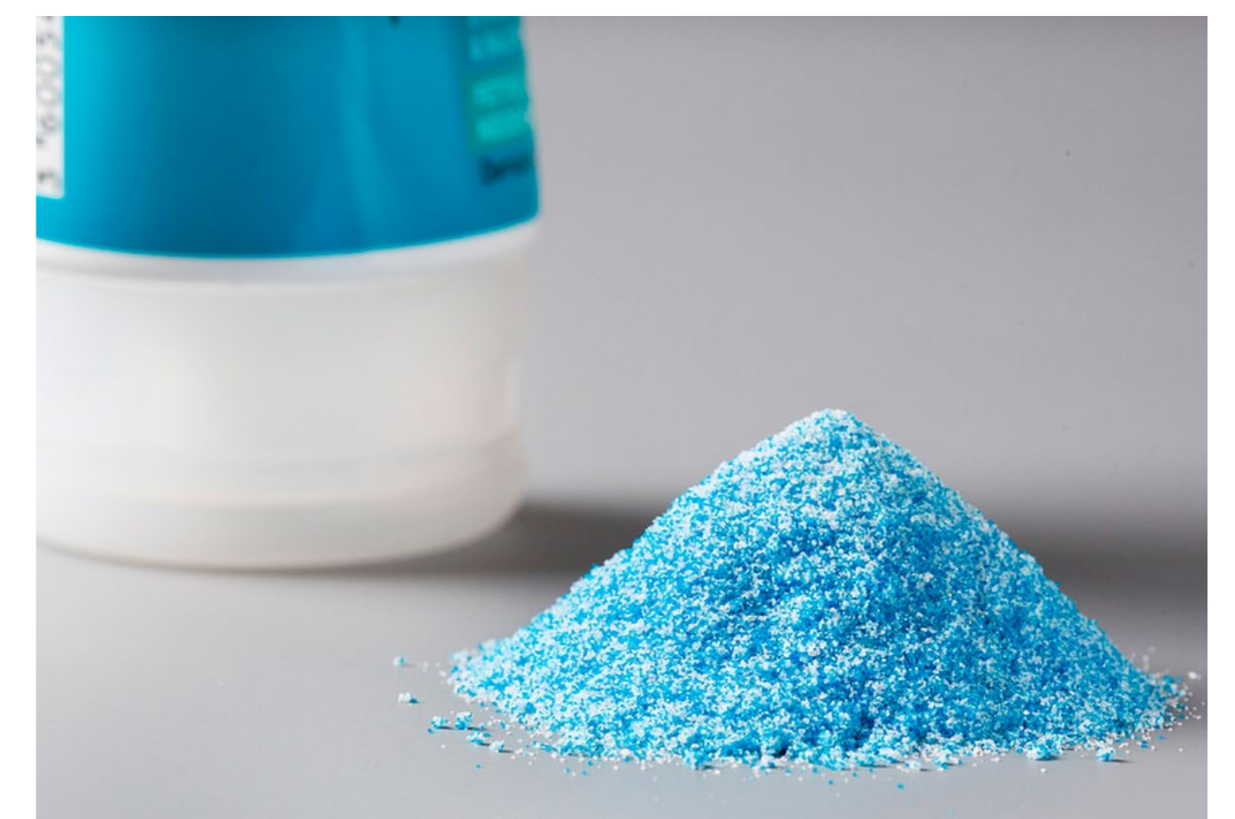
Mikroplastik ist Bestandteil in vielen Kosmetikprodukten.