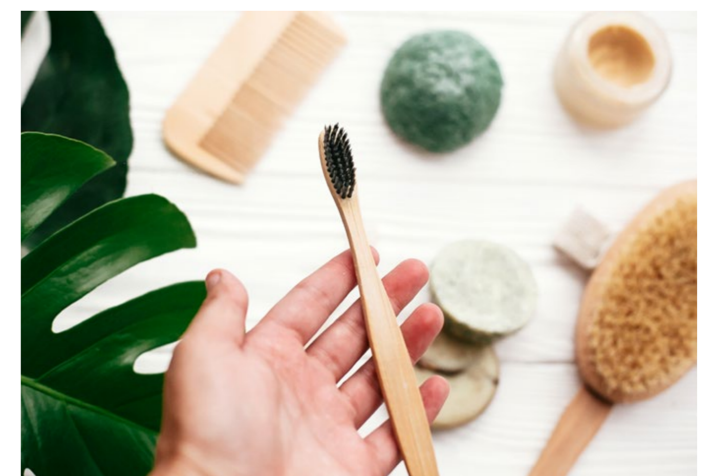
Plastikfrei im Badezimmer