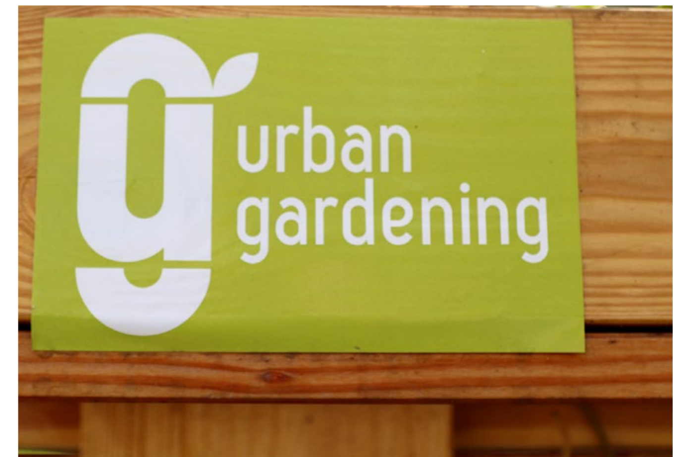
Das Projektlogo