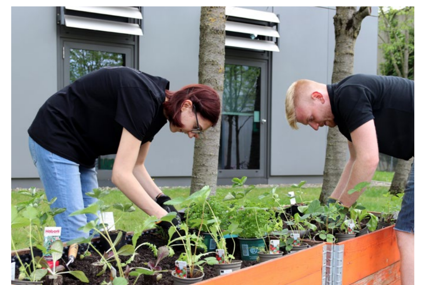
Pflanzaktion der Studierenden der Hochschule Augsburg.