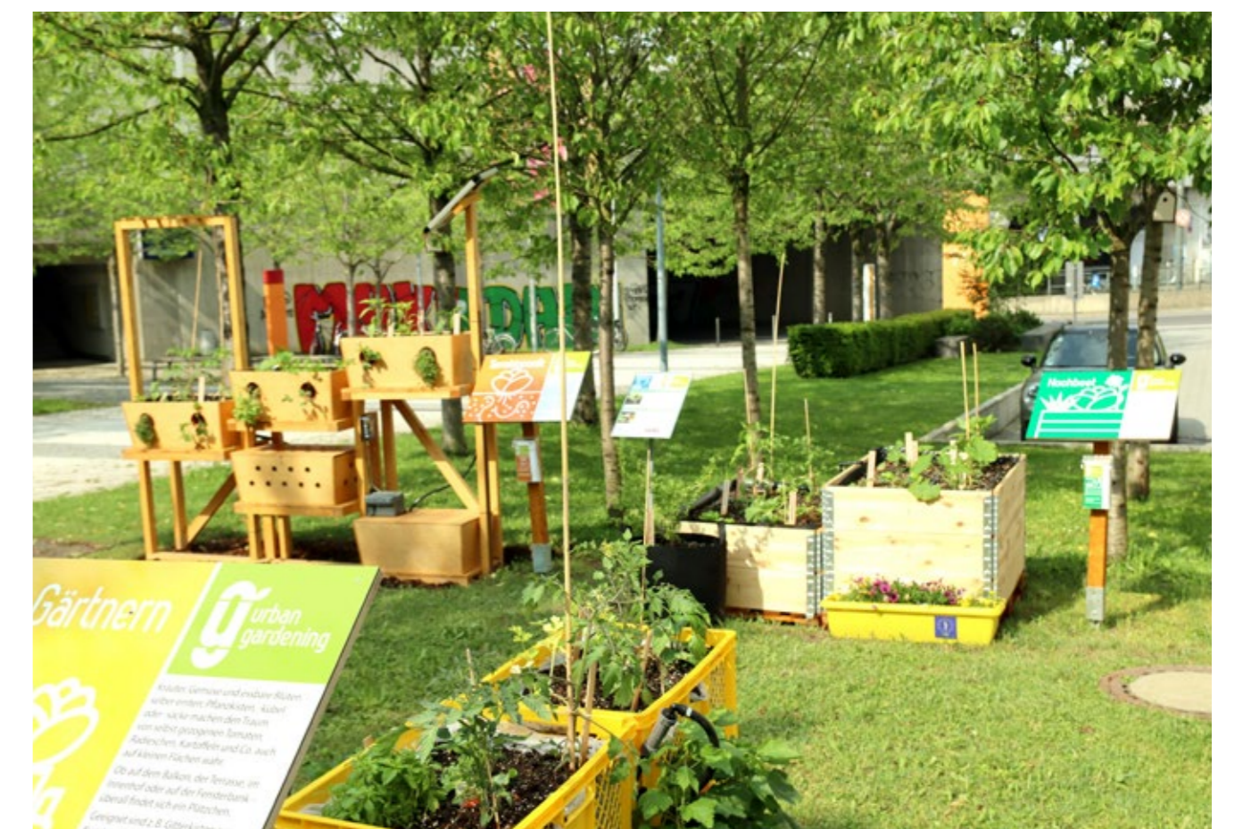
Innovative Pflanzkästen im Demonstrationsgarten an der HSA.

Studierende und Lehrende begleiten den Urban-Gardening-Demonstrationsgarten im Projekt HSA_transfer im Rahmen der Bund-Länder-Initiative Innovative Hochschule bis zum Herbst 2022. Interessierte nehmen gerne Kontakt per E-Mail auf: nachhaltigkeit@hs-augsburg.de .