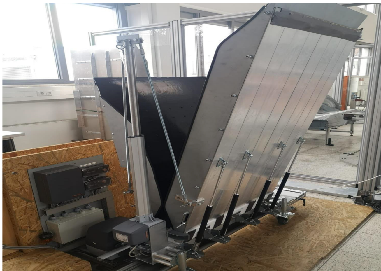
Prototyp im eingefahrenen Zustand