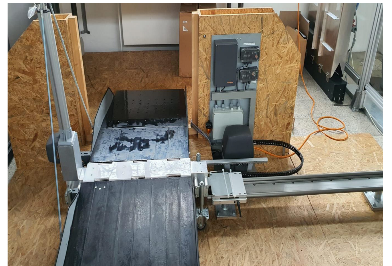
Prototyp im ausgefahrenen Zustand