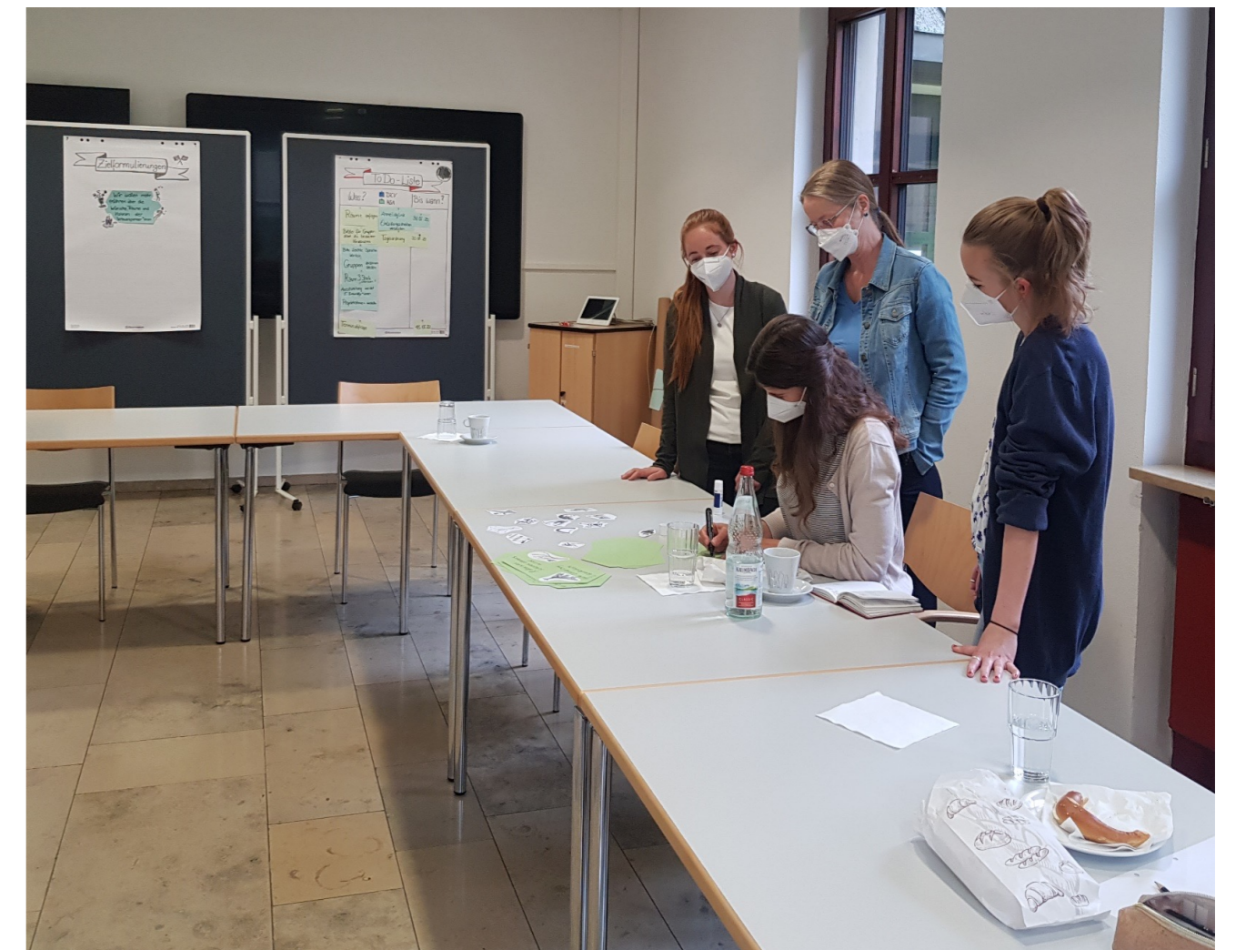
Im Kick-off-Workshop wurde gemeinsam mit den Transferpartner:innen gearbeitet