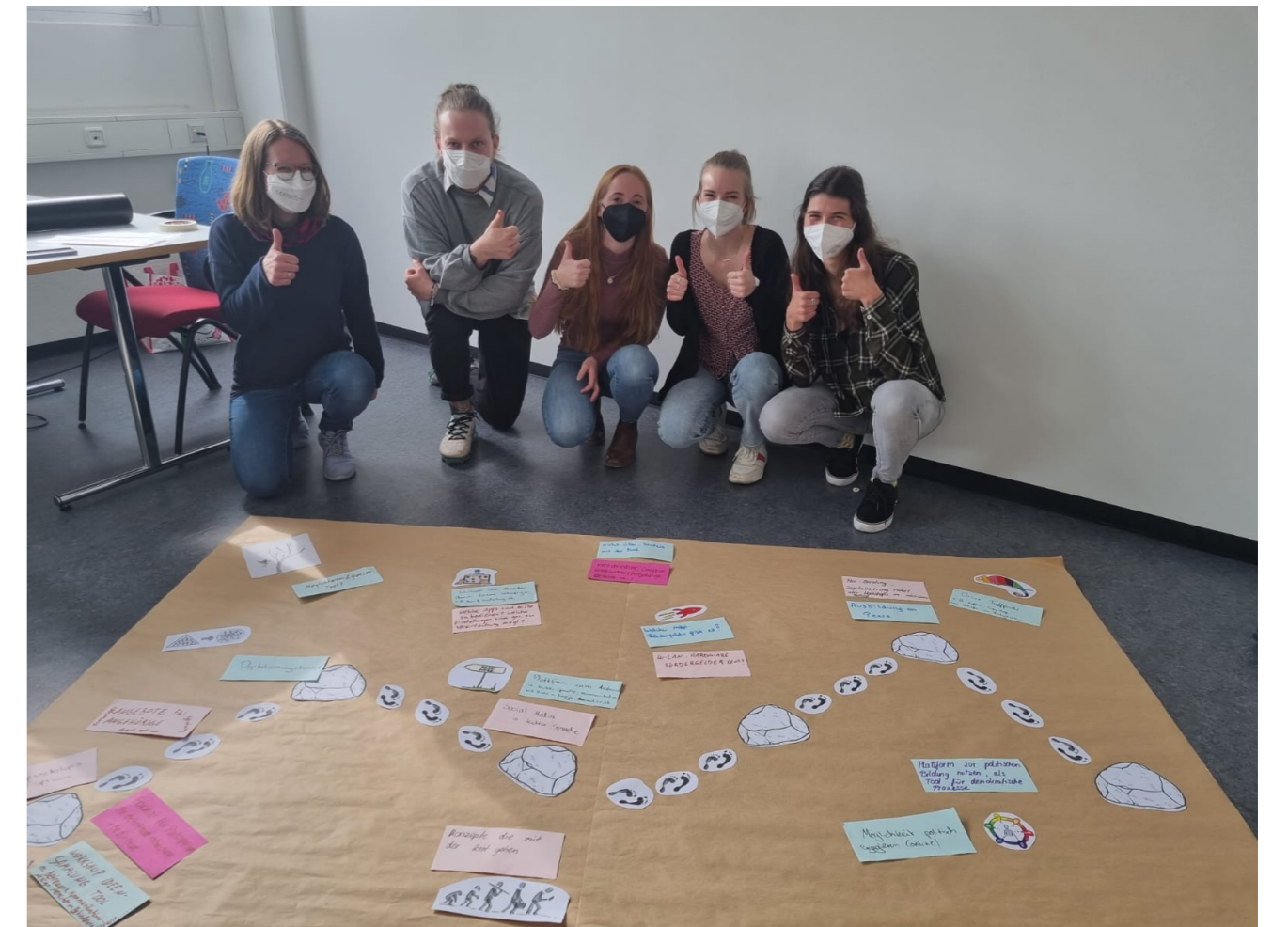
Im Transferprojekt DiTeil haben die Studierenden der Sozialen Arbeit innovative Ansätze für die digitale Teilhabe entwickelt, Quelle: Martin Stummbaum

Im Rahmen des Service-Learning-Projekts „DiTeil“ unterstützen Studierende der Sozialen Arbeit den Caritasverband der Diözese Augsburg e.V. bei der partizipativen Realisierung eines innovativen Transferprojekts zur digitalen Teilhabe von Menschen mit Behinderung. Im Sommersemester 2022 konzeptionierten und organisierten die Studierenden einen partizipativen Kick-off-Workshop, um dieses Projekt nicht für, sondern mit Menschen mit Behinderung durchführen zu können.