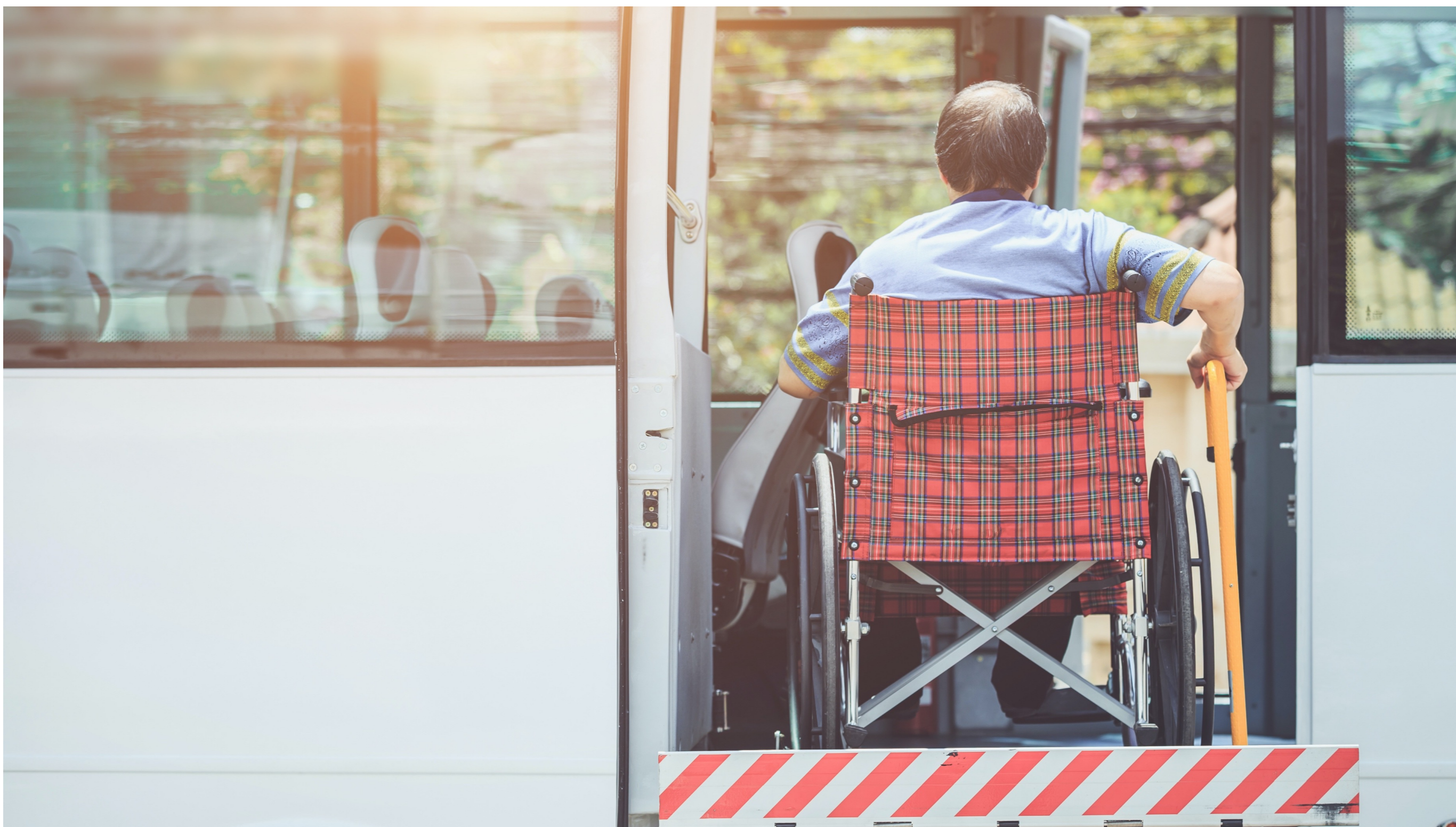
IM ÖPNV ist Teilhabe möglich – Studierende entwickeln im Transferprojekt DiTeil nun auch für die digitale Teilhabe innovative Konzepte, Quelle: Colourbox