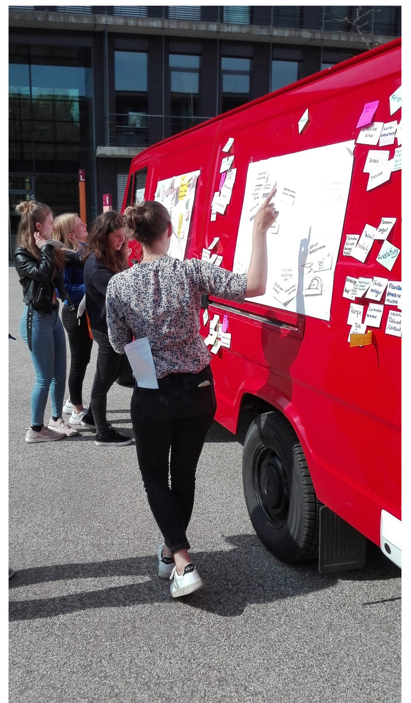
Im Workshop wurden viele innovative Ideen notiert, Quelle: Hochschule Augsburg / Verena Kiss