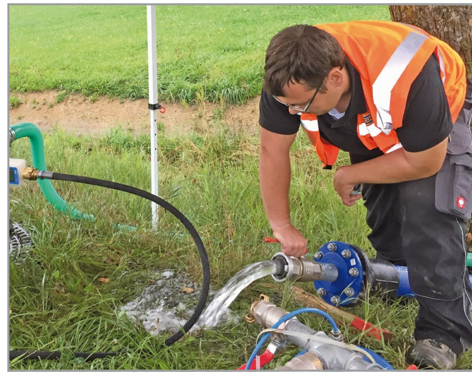
Durchführung einer Versuchsreihe an einer in Betrieb befindlichen Abwasserdruckleitung