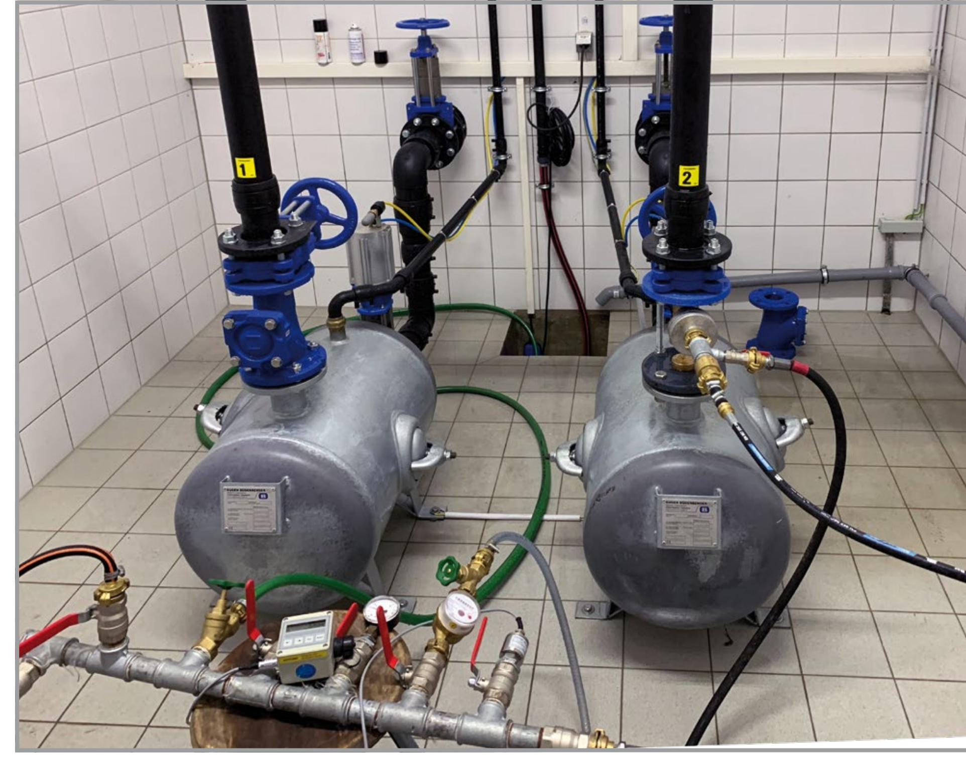
Pumpwerk mit Prüfequipment bei der Dichtheitsprüfung nach dem HSA-Normalverfahren

Dieses sogenannte HSA-Normalverfahren ist mittlerweile in Bayern als Prüfverfahren zu verwenden.