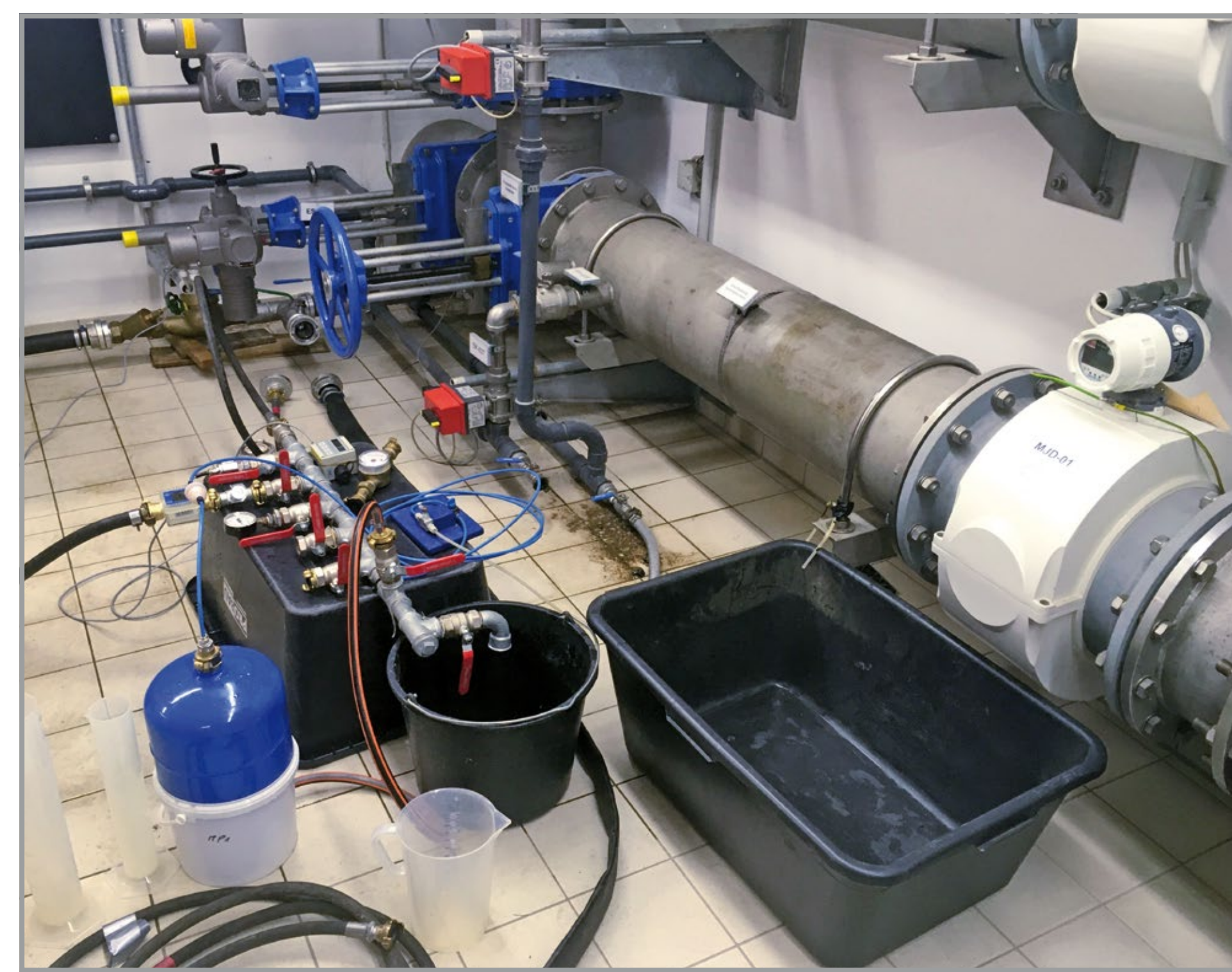
Durchführung einer Dichtheitsprüfung nach dem HSA-Normalverfahren an einer Asbestzementleitung