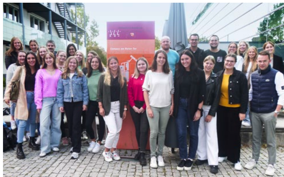
Die Studierenden des Masterstudiengangs Personalmanagement im Wintersemester 2023/24.