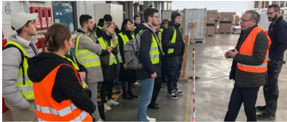
Studierende zu Besuch bei der Andreas Schmid Logistik AG

Der nächste Halt führte die Gruppe zu Hosokawa Alpine AG, einem Experten im Bereich der Verfahrenstechnik. Die Studierenden erhielten einen Einblick in hochpräzise Maschinen und Anlagen, die in der Lebensmittel- und Pharmaindustrie eingesetzt werden. Die Diskussion mit Fachleuten verdeutlichte die Bedeutung von Präzision und Innovation im Bereich der Anlagen, aber auch die logistischen