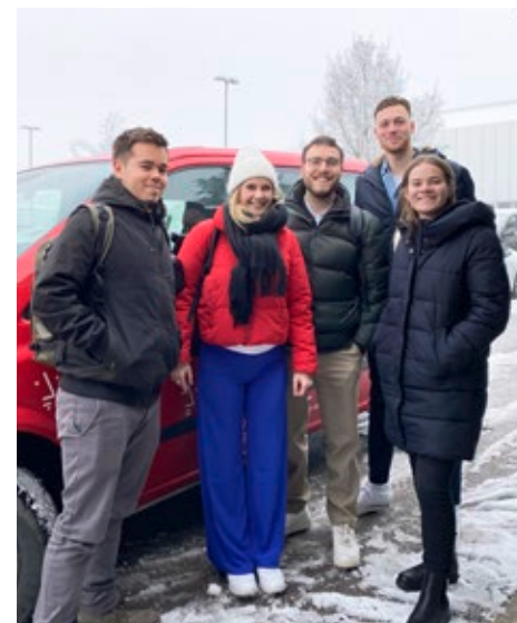
Mitglieder:innen des studentischen Projektteams