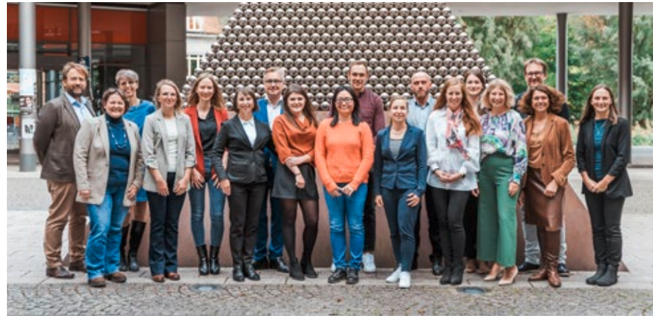
Zeugnisübergabe im Sommersemester 2023: Herzlichen Glückwunsch allen Absolvent:innen.

Die Arbeitswelt verändert sich derzeit schneller denn je: Dem technologischen Fortschritt, den wirtschaftlichen und demographischen Entwicklungen sowie auch den alternierenden politischen Umständen muss Rechnung getragen werden, wenn ein Unternehmen erfolgreich am Markt bestehen oder sich etablieren will. Die Leistungsfähigkeit ist dabei abhängig vom Know-How und Können ihrer Mitarbeiter:innen. Weiterbildung bzw. lebenslanges Lernen ist somit essentiell, um die Wettbewerbsfähigkeit zu verbessern und das Unternehmen auf die Anforderung einer sich ständig verändernden, globalisierten Welt vorzubereiten. Die Forschungsgruppe THA_ops sieht diese Notwendigkeit natürlich auch in ihrem Tätigkeitsfeld, der optimierten Wertschöpfung, und hat zwei weiterbildende Zertifikatsstudiengänge auf den Markt gebracht: 2017 kam mit dem „Prozess-