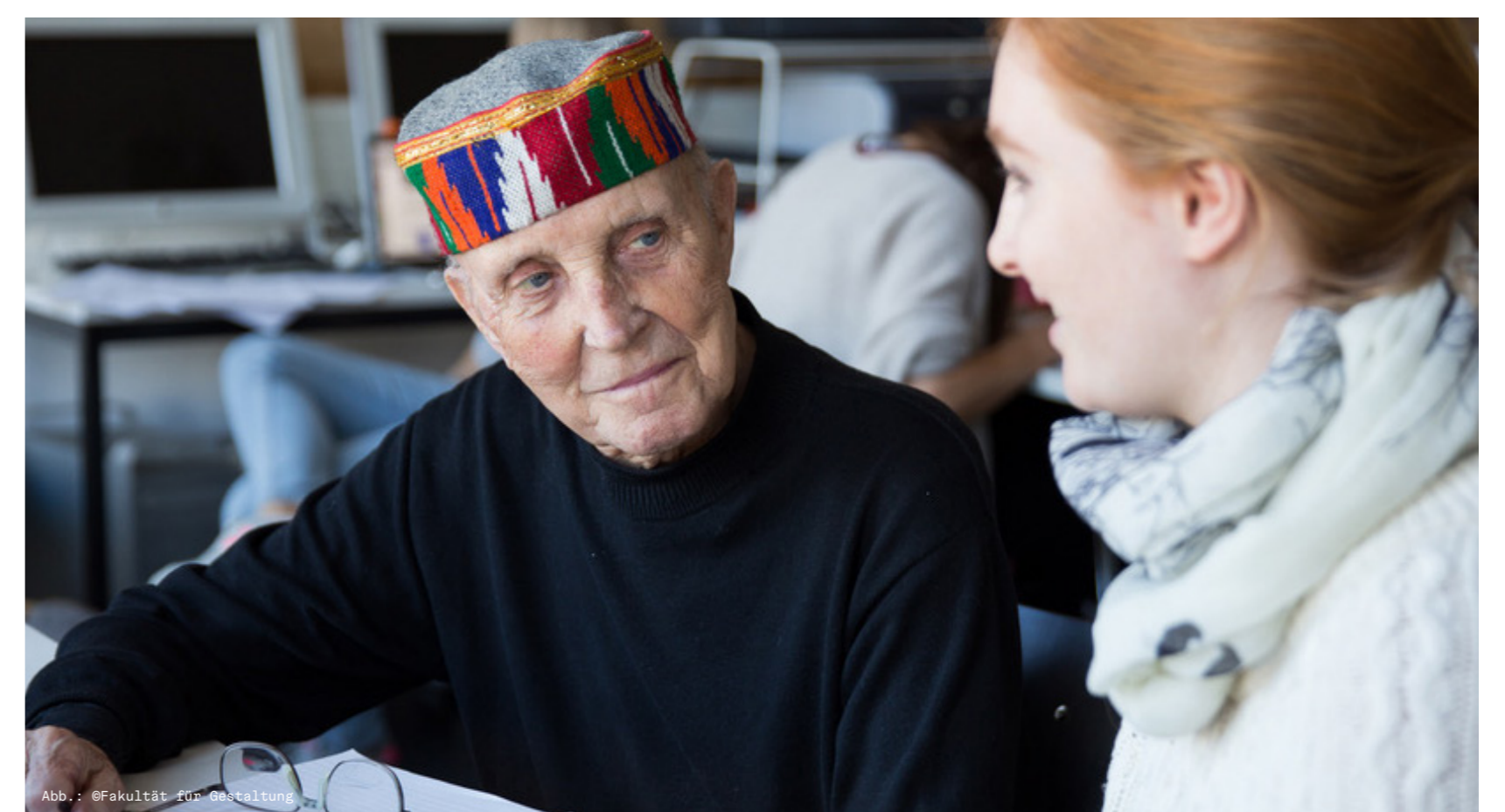
Netzwerke stärken: Design-Ikone Ken Garland auf der Werkwoche