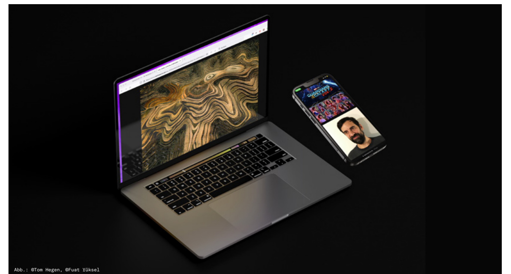
Die Werkwoche demnächst mit neuer Website

Die gedruckte Dokumentation blickt auf die zehnjährige Geschichte der Designweek zurück und beleuchtet die Highlights. Ein Designteam unter Leitung von Professor Bergmann beginnt mit der Konzeption und der Sichtung des Werkwoche-Archivs.