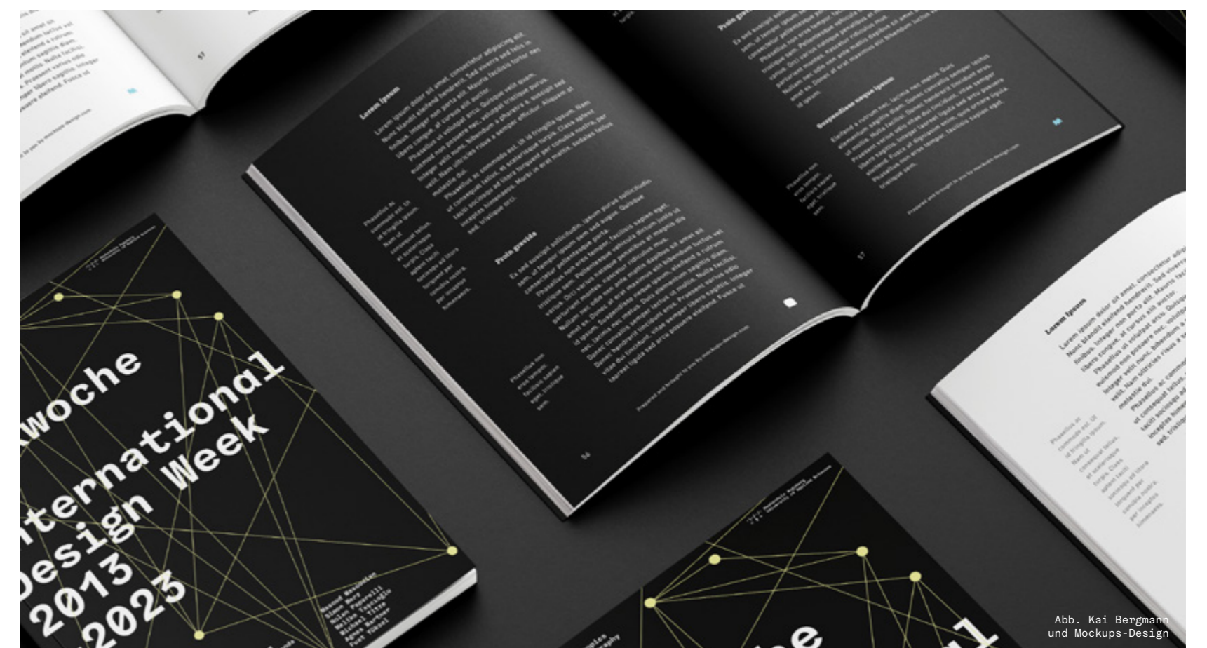
Buchentwurf für die Jubiläums-Dokumentation 2013 - 2023